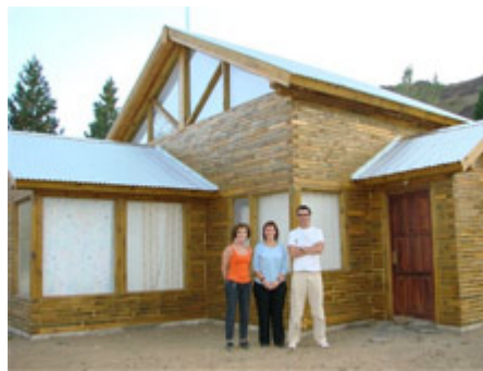
Ampliar foto +

El sistema se basa en troncos y raleo de ponderosa que se cortan y molduran en 3" x 5". Los troncos contienen ranurados hembra en la cara superior e inferior donde se inserta una lengüeta que une las piezas entre si.