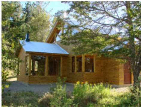
Ampliar foto +

.: En Manzano Amargo, noroeste de Neuquén, la empresa "Domuyo" emplea la madera con un alto nivel de aprovechamiento de la materia prima. Por esa razón, personal de la SAGPyA se trasladó al lugar para observar y analizar el nivel de desarrollo alcanzado y al mismo tiempo explorar la posibilidad de promocionar el sistema constructivo empleado.