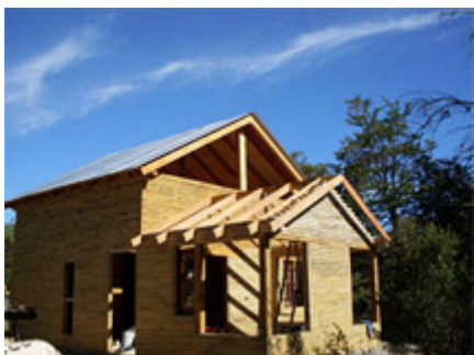
Ampliar foto +

:: Todas las juntas se protegen con sellador y las superficies con pintura tipo lasur.