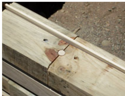
Ampliar foto +

:: Todas las juntas se protegen con sellador y las superficies con pintura tipo lasur.