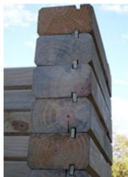
Ampliar foto +

El sistema se basa en troncos y raleo de ponderosa que se cortan y molduran en 3" x 5". Los troncos contienen ranurados hembra en la cara superior e inferior donde se inserta una lengüeta que une las piezas entre si.