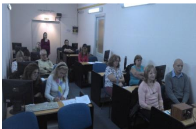
Participantes del Foro