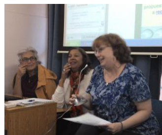
Miembros de CD